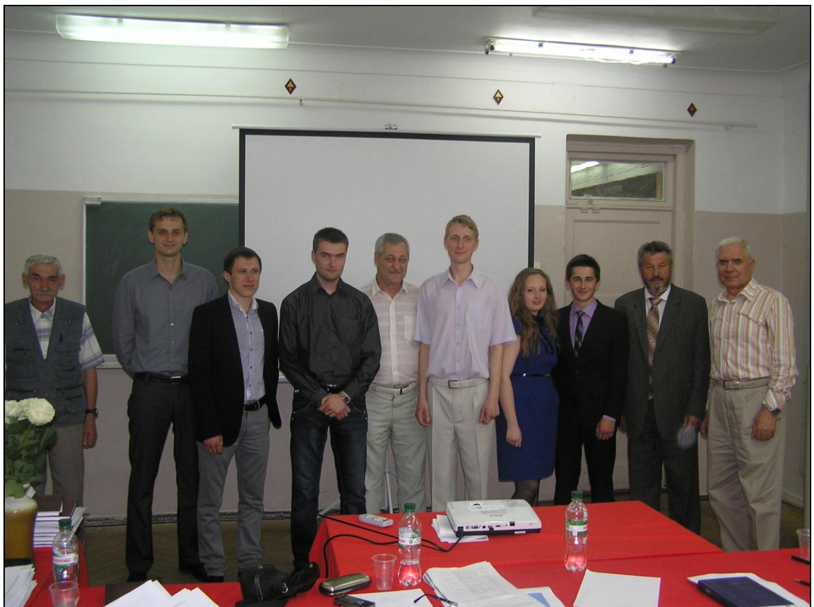
Фото 6. Учасники GIS Market Day